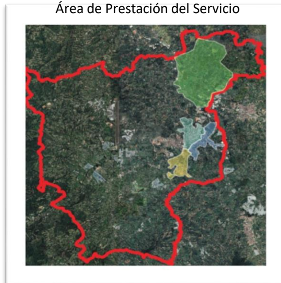
Área de Prestación del Servicio

Cláusula 26. FRECUENCIAS Y HORARIOS PARA LA PRESTACIÓN DE LA ACTIVIDAD DE APROVECHAMIENTO EN EL APS DECLARADA. La persona prestadora de la actividad de aprovechamiento deberá diligenciar la siguiente tabla, especificando los horarios y frecuencias de recolección de los residuos aprovechables correspondientes a cada una de las macro-rutas definidas en el APS declarada.